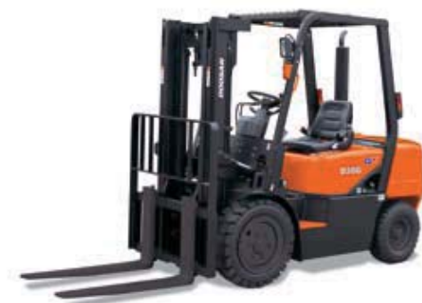
D20G / D25G / D30G 2 000kg 2 500kg 3 000kg Luftbereifung