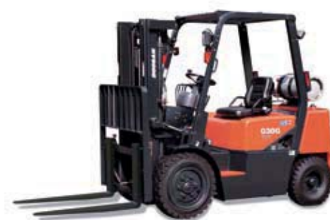
G20G / G25G / G30G 2 000kg 2 500kg 3 000kg Luftbereifung